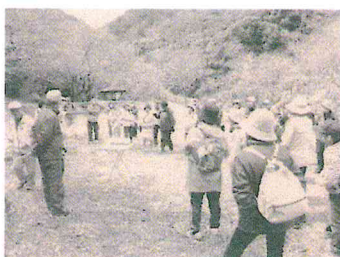
2017年度4月1日実施写真

集合場所：時間 波太神社前広場 9:30 出発 9:45 解散場所：時間 波太神社前広場 14:30予定 主催 まちおこし夢テラス 阪南はなやか観光協会